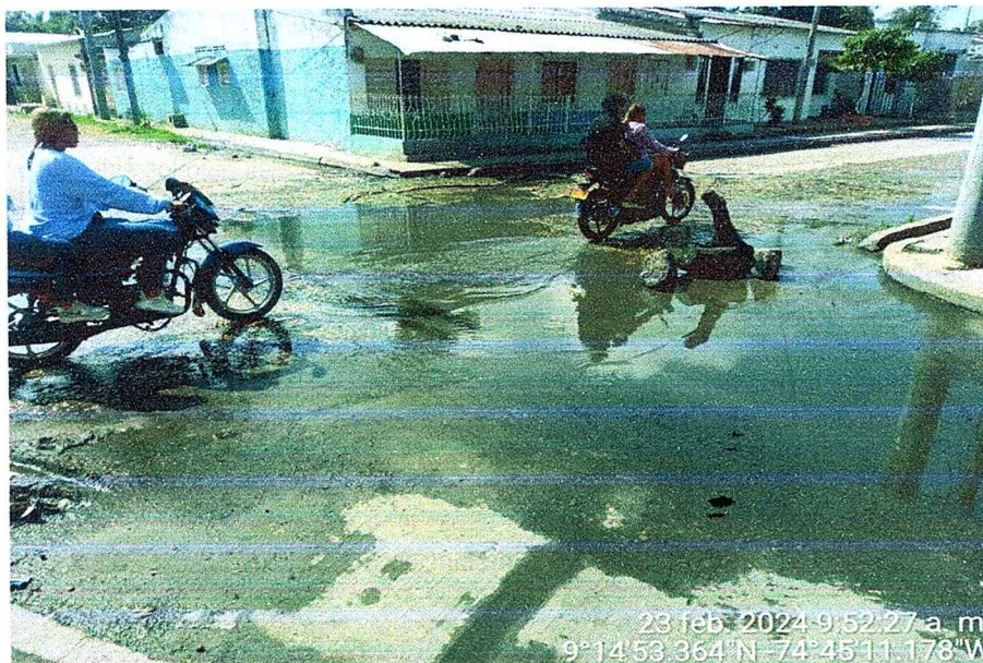
Figura N:3. Intersección de la calle 15 con la Carrera 21.