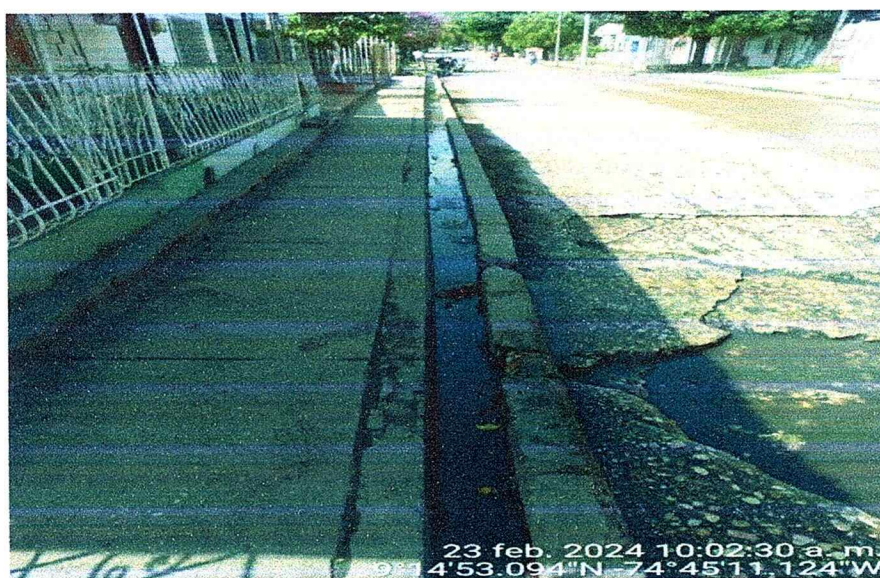
Figura N:4. Aguas servidas que provienen de viviendas.