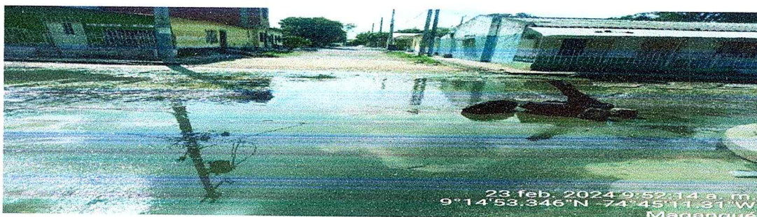
Figura N:2. Intersección de la Calle 15 con la Carrera 21.